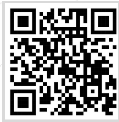
QR Code สำหรับลงทะเบียน

หมายเหตุ : 1) สอบถามความคืบหน้าการลงทะเบียน