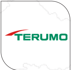
บริษัท เทอรูโม (ประเทศไทย) จำกัด