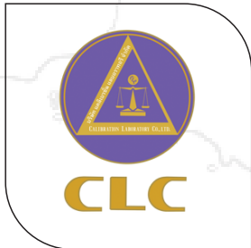
บริษัท แคลิเบรชั่น แลบอราทอรี จำกัด