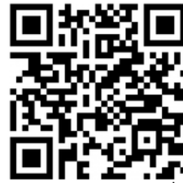
QR Code แผนที่