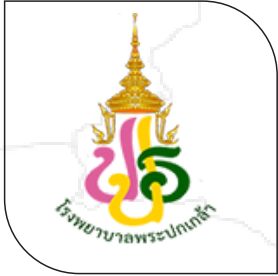
โรงพยาบาลพระปกเกล้า