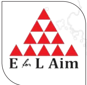
บริษัท อี ฟอร์ แอล เอ็ม จำกัด (มหาชน)