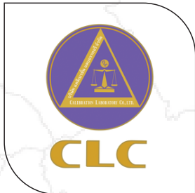
บริษัท แคลิเบรชั่น แลบบอราทอรี จำกัด