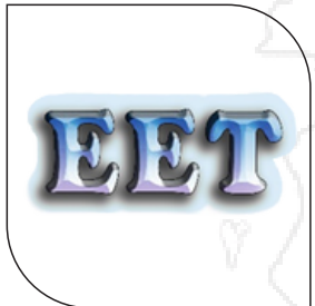
บริษัท อีเล็คทริก้า เอ็น-เทค จำกัด